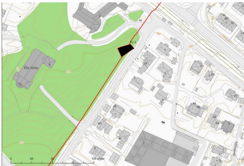
Figur 4. Riggområde R1-2 NV1 ved Ris kirke.

I detaljplanen beskrives det at ett av riggområdene vil være i nærheten av Ris kirke, der kummen med tilgang til kabelen er lokalisert midt imellom en gruppe med trær, se figur 5. Det fremgår ikke av detaljplanen hvorvidt trærne kan bli stående gjennom anleggsperioden.