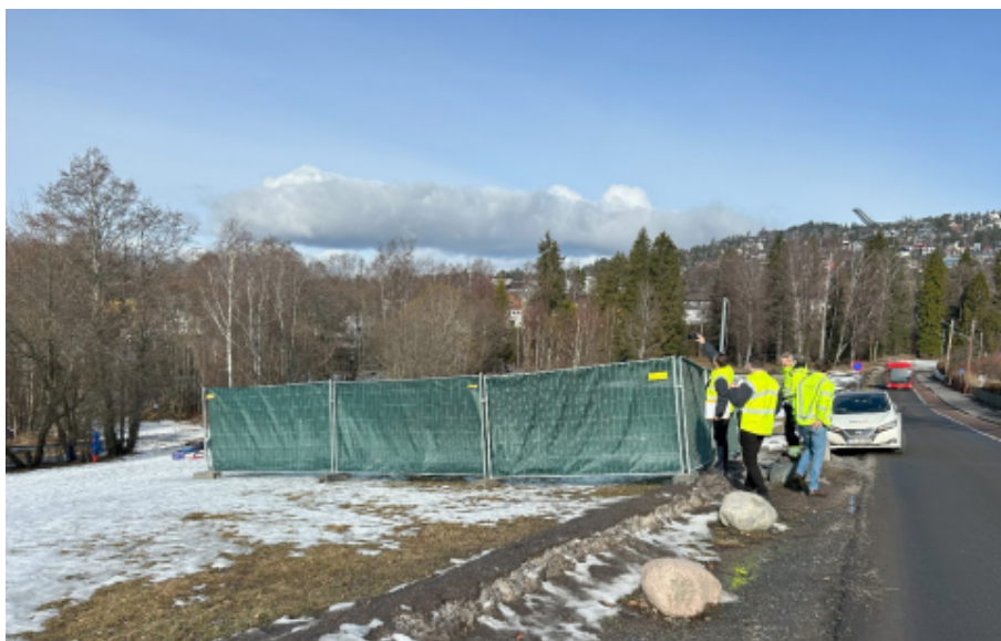
Figur 2 – Riggområde R2-3 ved Tråkka NV2.

Makrellbekken (se R2-4 på figur 1). Dette er arealer med henholdsvis gressplen og blandet vegetasjonsdekke.