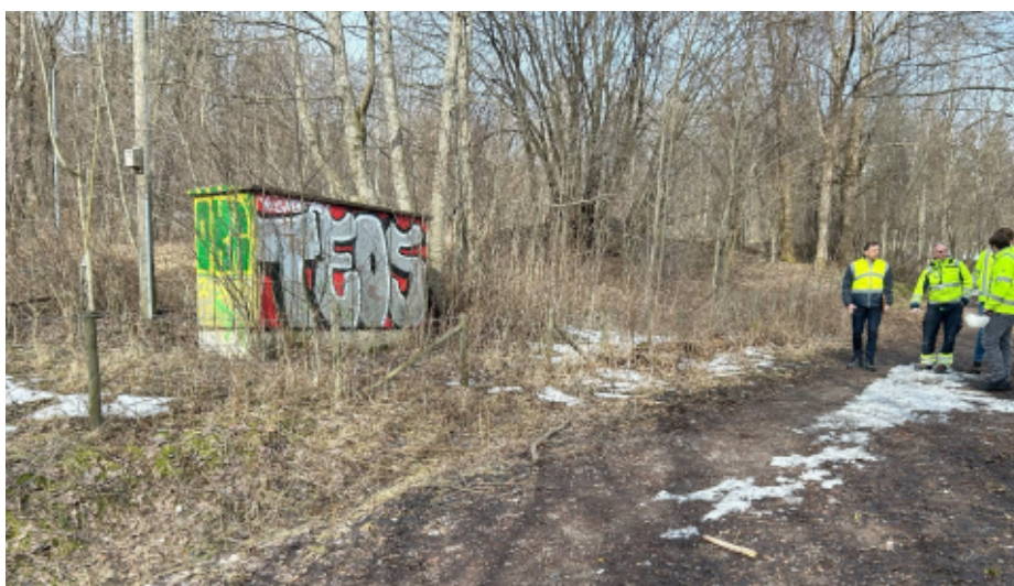
Figur 3 – Riggområde R2-4 ved Makrellbekken NV2.

Statnett oppgir i detaljplanen at ved terrenginngrep skal vegetasjonslaget tas av og sikres der det er mulig, slik at massene kan tilbakeføres ved istandsetting. Videre skriver Statnett at arealbruk til midlertidige riggplasser i terrenget skal tilbakeføres til opprinnelig bruk, med naturlig revegetering. Arealer der det er opparbeidet plen i dag vil det bli sådd med plenfrøblanding. Objekter og tekniske installasjoner som har inngått som en del av energianlegget fjernes, med unntak av betongkummer som fjernes ned til 20 cm under bakken. Deretter fylles det opp med pukk med et topplag av vekstmasser.