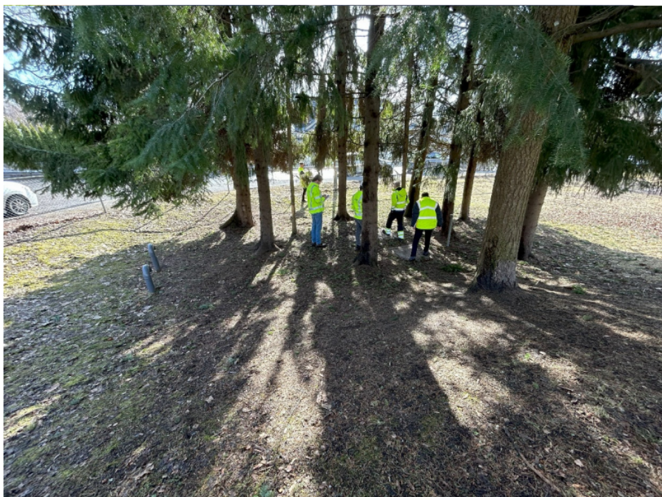
Figur 5. Trærne som omkranser kummen ved riggområde R1-2 ved Ris kirke.

For lokalmiljøet, bybildet og naturmiljøet er det positivt at eksisterende vegetasjon blir bevart. Det går ikke frem av detaljplanen om det er behov for å helt eller delvis fjerne noen av trærne, og eventuelt hvilke avbøtende tiltak som er planlagt. NVE legger til grunn at arbeidene skal gjennomføres slik at trærne ved riggområde R1-2 ikke blir negativt påvirket. Dersom trær rundt kummen hindrer gjennomføringen av anleggsarbeidene ved riggplass R1-2, vil dette være en endring av detaljplanen som eventuelt må søkes NVE. Ved en slik søknad skal det i samråd med arborist eller tilsvarende med kompetanse på hogst og beskjæring av trær, fremlegges en vurdering av behovet, omfanget og gjennomføringen av hogst og avbøtende tiltak for å få gjennomført anleggsarbeidene.